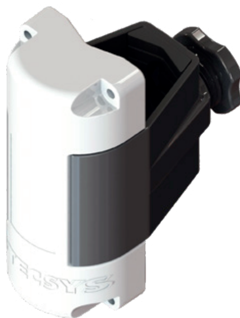
Figura 3: Koala Superior