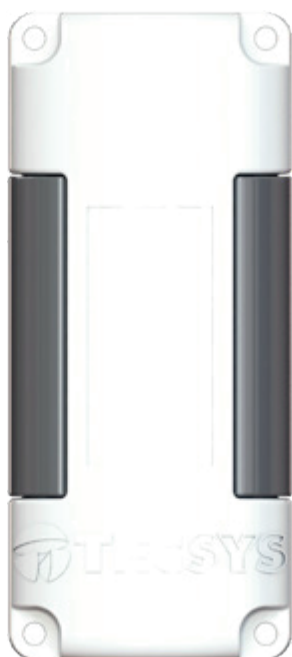
Figura 2: Koala Frontal