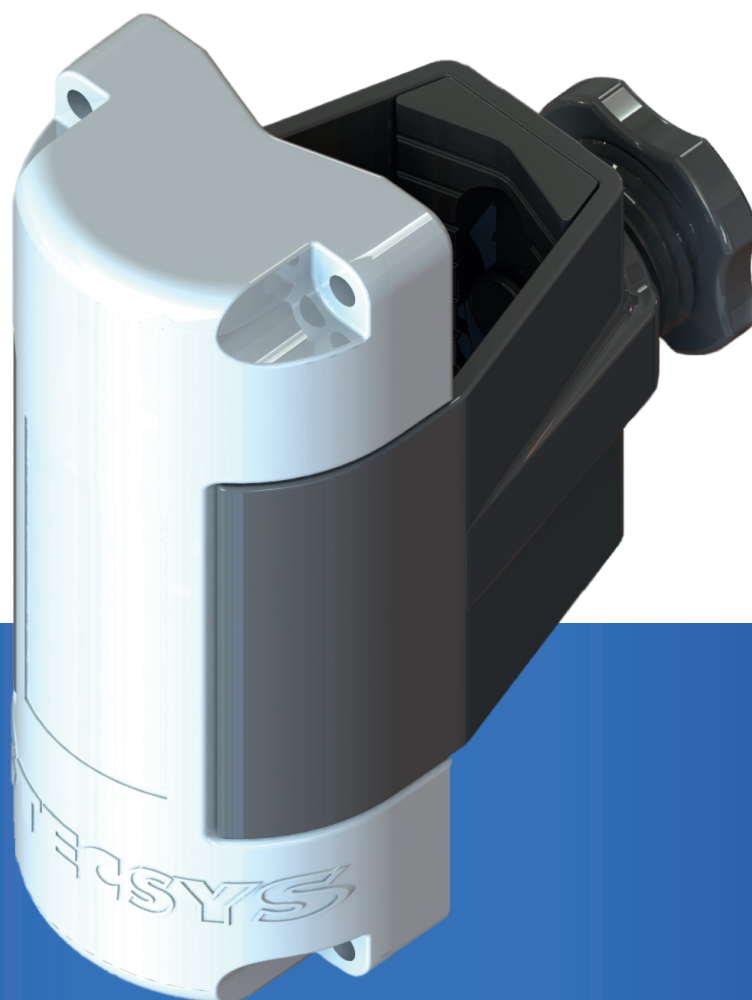
TS300S KOALA Monitor de Base Fusível